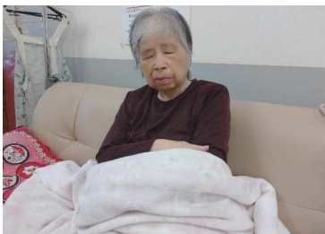
ご飯を食べた後は…

屋食後、ソファに座り休んでいると…うとうとし始め、気持ちよくなってしまったようです。