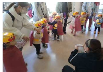
ハロウィンパレード

長い距離でしたが、全員歩き切ることが出来ました。お店の方から上手にお菓子を受け取る事ができ、嬉しそうにしていました。