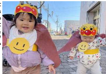
ハロウィンパレード

全員人見知りせずハロウィンパレードを楽しむことができました。手を振ったり、お辞儀をして次々と地域の方々を虜にしています。