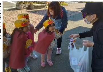
ハロウィンパレード

お菓子をもらう前には、みんなで「トリックオアトリート！」と言い、ハロウィンを満喫していました。おれも言えて、素敵なすみれ組さんでしたよ。